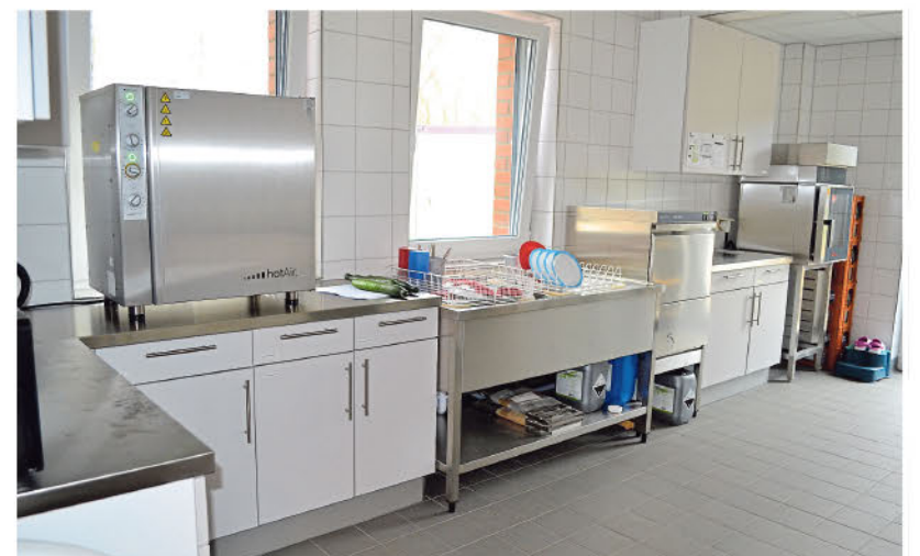
Blick in die moderne Küche des Kindergartens

In erstaunlicher Geschwindigkeit ist es der Samtgemeindeverwaltung gelungen, ausreichend Personal für die zusätzlichen Betreuungszeiten anzustellen, sodass der Personalstamm nun auf elf Fachkräfte plus Vertretungskräfte angewachsen ist.