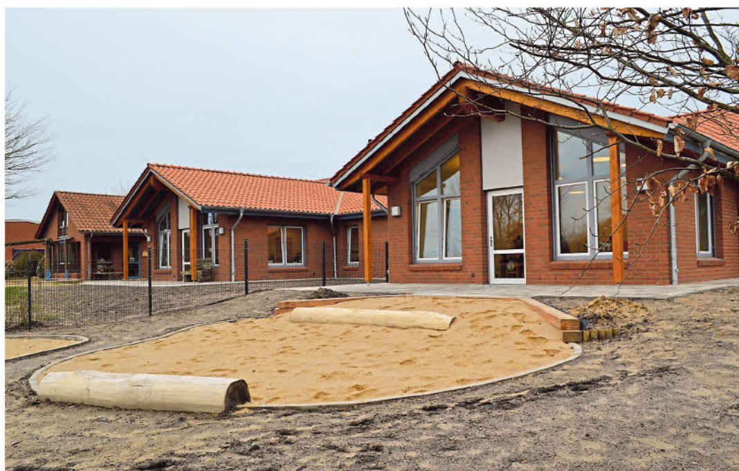
Die Kindertagesstätte in Appel: links die bestehende Einrichtung. Der Anbau (re.) fügt sich hervorragend an das Bestandsgebäude an

Wir bedanken uns für den Auftrag und für die gute Zusammenarbeit.